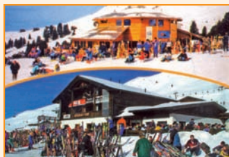
ZISCHGALM Tel: 0462 813600

Ci trovate nel camposcuola di Pampeago, che si raggiunge prendendo la seggiovia Latemar a Pampeago.