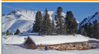
BAITA CASERINA cene con trasorto in motoslitta, ristorante Km zero - Tel: 348.8924234